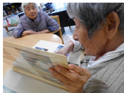
思い出のアルバムを皆さんで♪