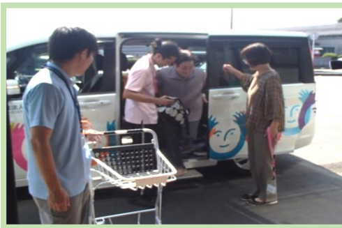
パシオ志比田店に到着！！