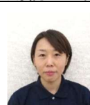
外 園 麗