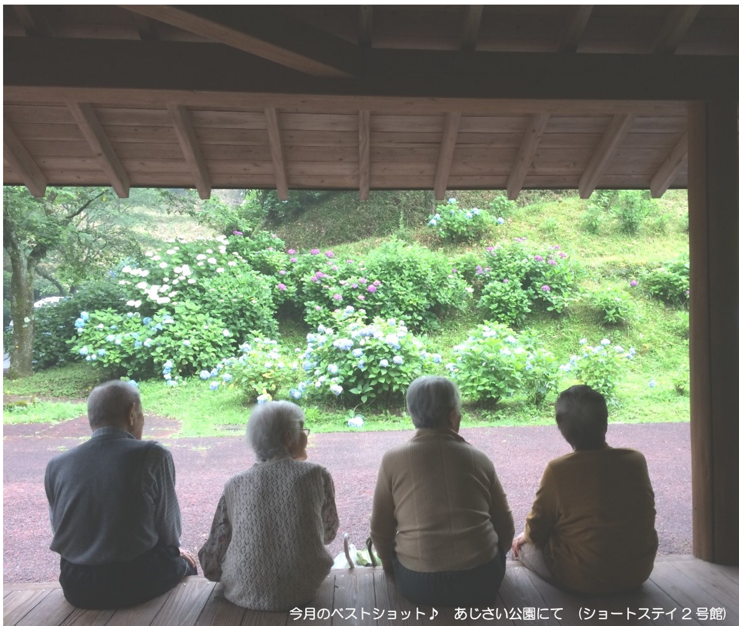
今月のベストショット♪ あじさい公園にて (ショートステイ2号館)

[平成27年7月号] 発行日：平成27年7月10日編集・発行 〒885-0093 都城市志比田町9573番地1 社会福祉法人 まりあ 発行人：施設長 江口 智美 編集長：永友 武志