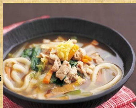
とろみがあるので冷めにくく、ゆっくり食べられて、おなか満足！