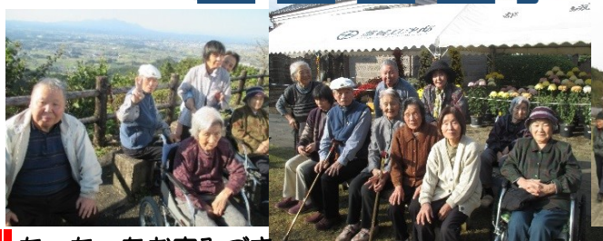
ちっちゃなお家みづき

方々の15名様お招きをしてそば打ちを行いました。おにぎりやがねと一緒に調理し、食事会も行いました。ご自分のそばを一生懸命作っておられ、出来上がったそばを美味しく食べられました。