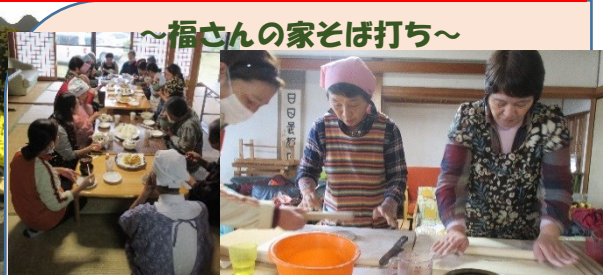
～福さんの家そば打ち～

方々の15名様お招きをしてそば打ちを行いました。おにぎりやがねと一緒に調理し、食事会も行いました。ご自分のそばを一生懸命作っておられ、出来上がったそばを美味しく食べられました。