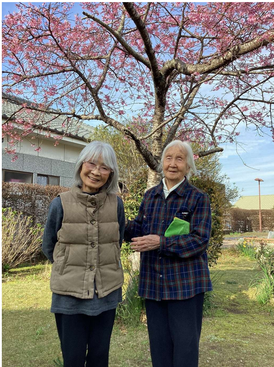
表紙【グループホームまりあ ユニット花】より

社会福祉法人まりあ 広報誌 令和 8 年 4 月 10 日 発行 (2 か月 1 回 10 日発行)