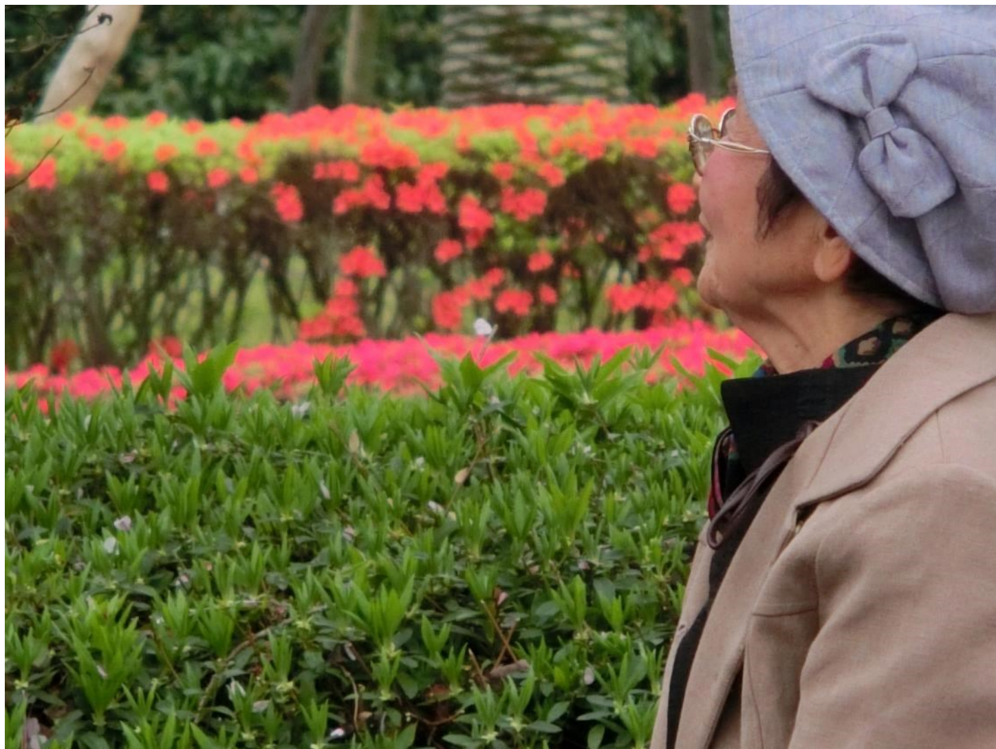
表紙【デイサービスセンターまりあ 郊外レクリエーションにて】

社会福祉法人まりあ 広報誌 平成 28 年 5 月 10 日 発行 (毎月 1 回 10 日発行)