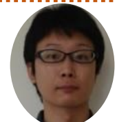
デイサービスセンター 椎屋 大樹

2号館が開設し2年目を迎えておりますが、スタッフ一同、御利用者様・御家族様に支えられてここまでやってきました。これからも、御利用者様・ご家族の方に安心して利用して頂けるよう、楽しく・充実したケアが行なえるよう努めていきたいと思っております。